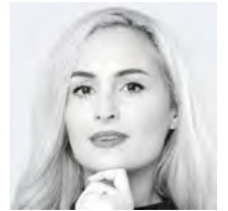
Sophia Weber Thomson Reuters